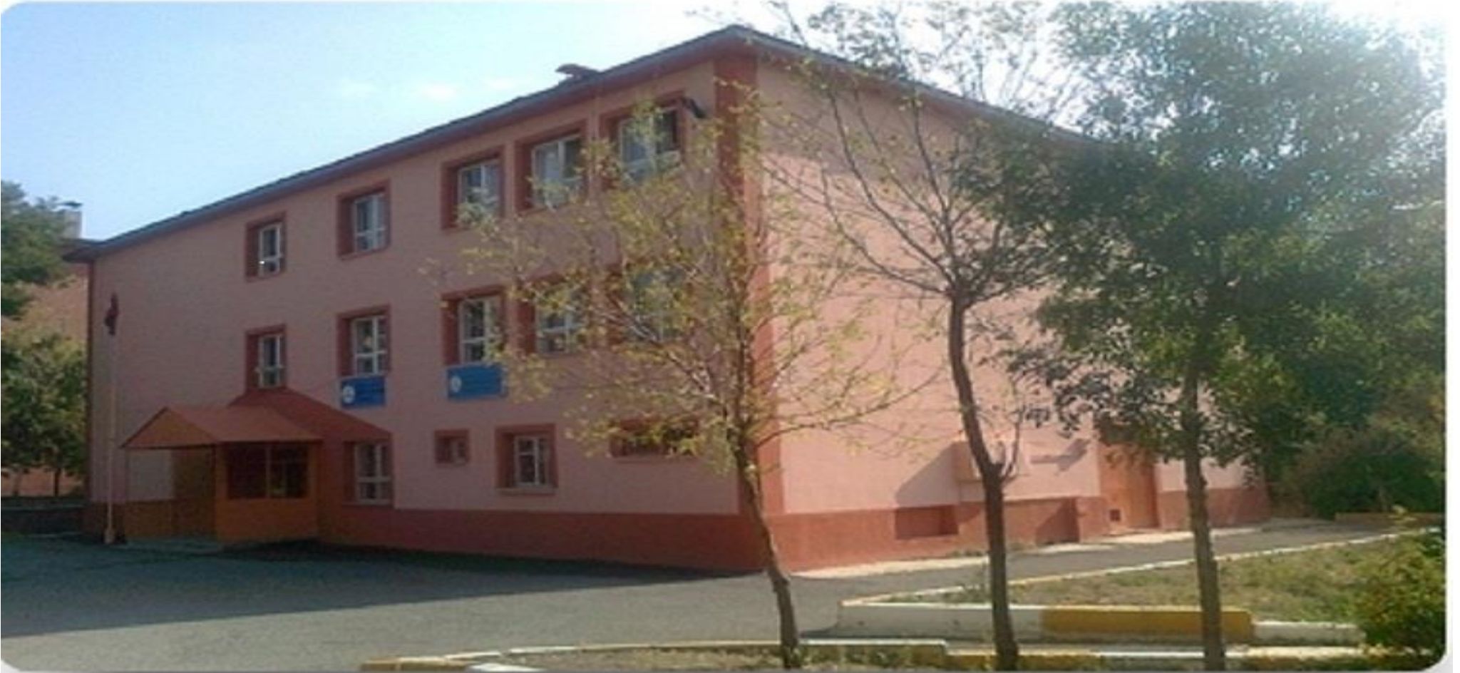
ŞEHİT ÜSTEĞMEN İSMAİL AKSU İLKOKULU